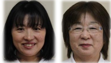
ほじよ ふくしま やすよ ほじよ おの みさよ